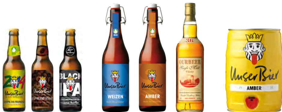
WM-Bier Espresso Stout Black IPA Weizen Bügel Amber Bügel Whisky Partyfass