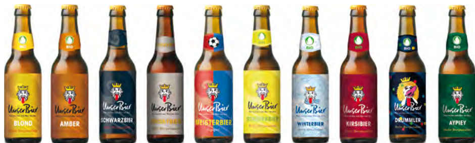
Blond Amber Schwarz Whisky Meister Sommer Winter Kirsibier Drummler Aypiey